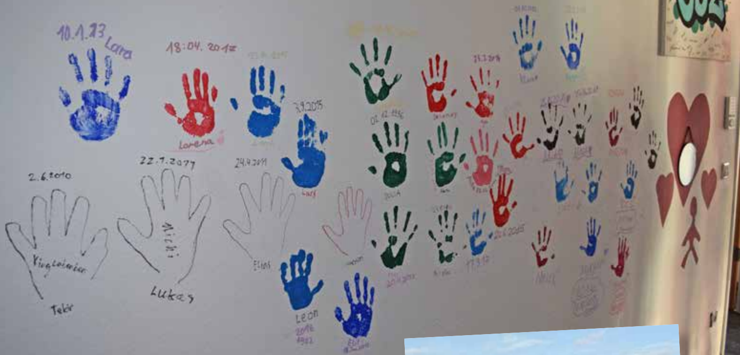
Helfende Hände werden verewigt