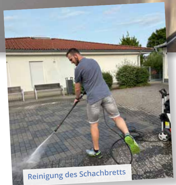
Reinigung des Schachbretts