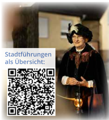
Stadtführungen als Übersicht: