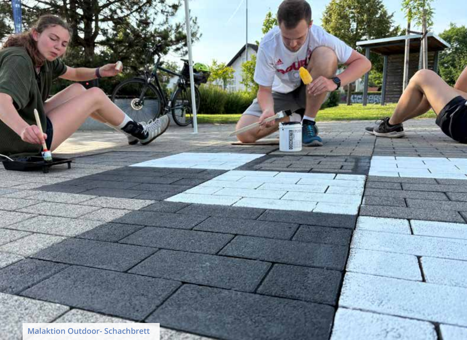
Malaktion Outdoor- Schachbrett