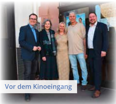
Vor dem Kinoeingang