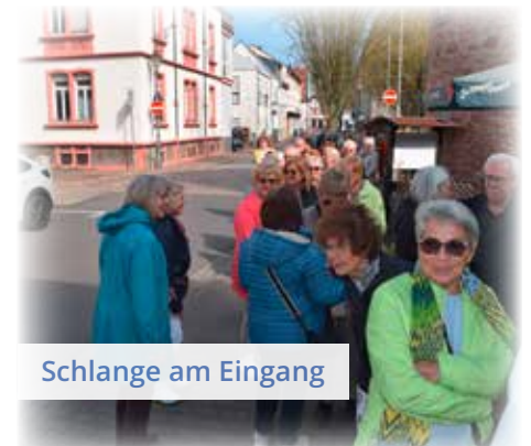
Schlange am Eingang