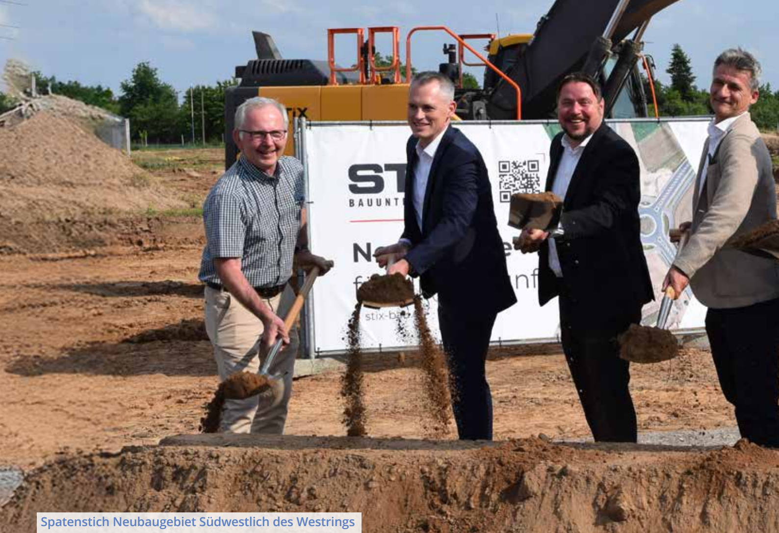
Spatenstich Neubaugebiet Südwestlich des Westrings