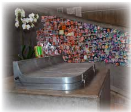
Taufbecken mit Fotos der Täuflinge

Der Taufbrunnen mit seinem Standort an der geschwungenen Verbindung von Ober- und Unterkirche ist kaum als solcher zu erkennen, dort aufgehängte Fotos von Täuflingen geben seine Bestimmung preis. Der Altar befindet sich in der Mitte der Kirche, umgeben von