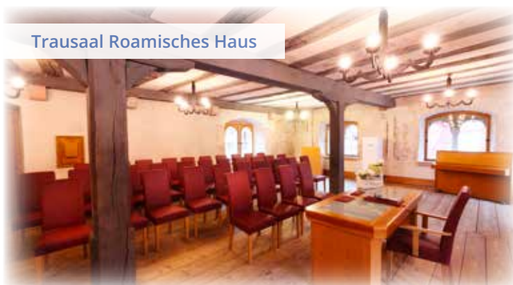
Trausaal Romanisches Haus

In beiden Trauzimmern stehen etwa 40 Sitzplätze zur Verfügung, im Romani-