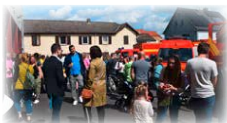
Neubürgerempfang an der Feuerwehr

über Angebote vor Ort und lädt zu einer kostenfreien Stadtführung ein. Die ersten Treffen dieser Art fanden im Bürgeramt statt, danach gab es wechselnde Standorte wie das Rathaus, den Rathaus-Innenhof, die Feuerwache, das Freischwimmbad, die Stadtwerte und das Stadion. Alle Zugezogenen erhalten direkt bei der Ummeldung eine Neubürgerbroschüre mit wichtigen Informationen an die Hand.