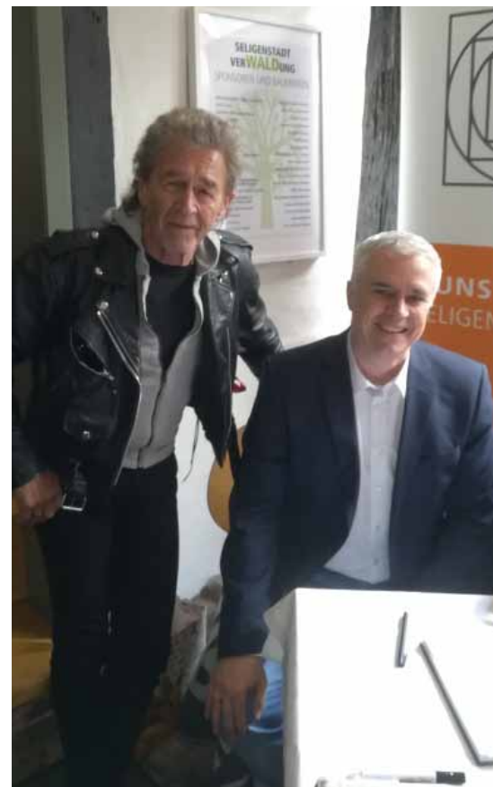
Bürgermeister und Peter Maffay