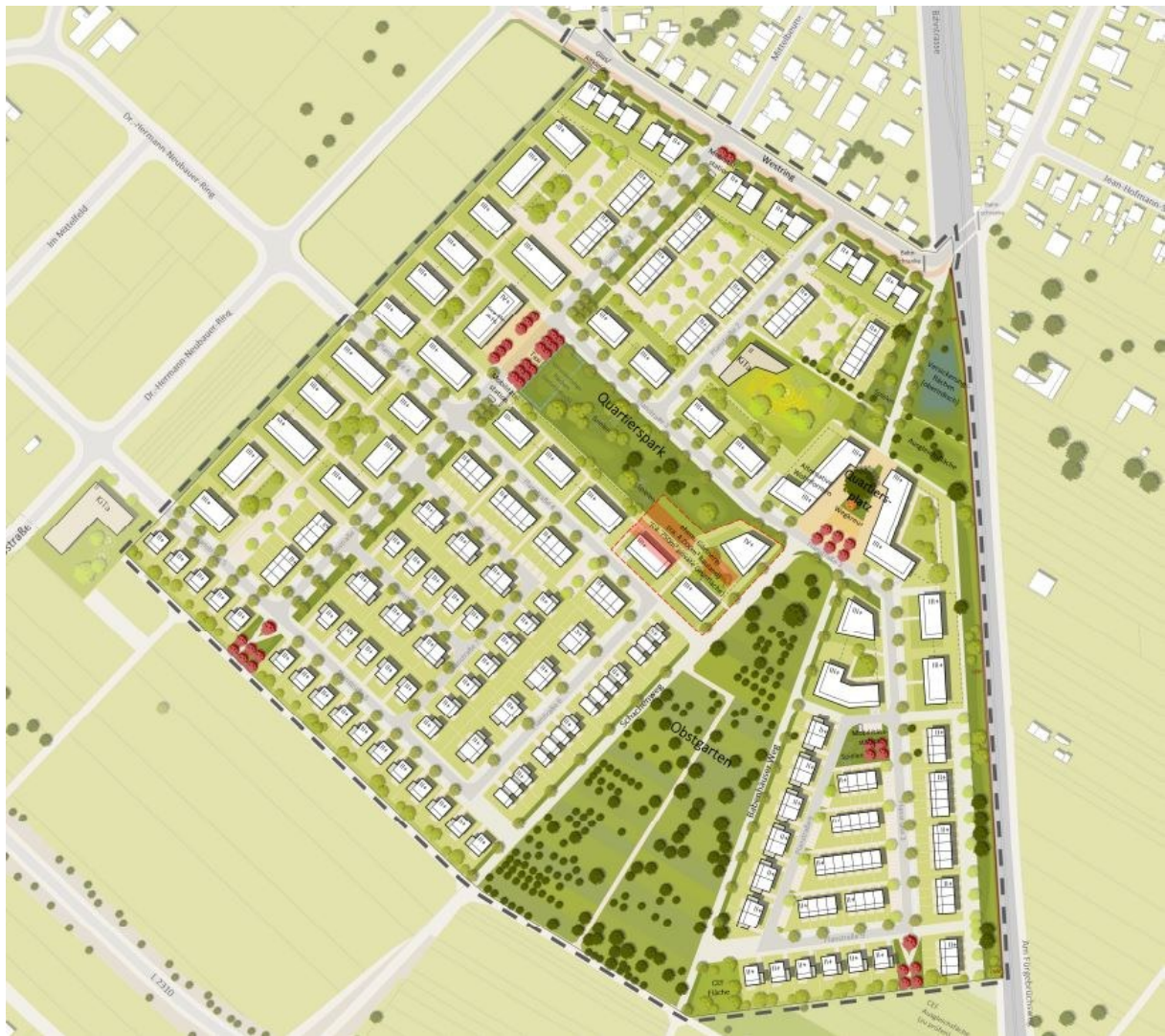
Abbildung 5: Städtebaulicher Entwurf – Rahmenplan, Stand: 24.02.2020